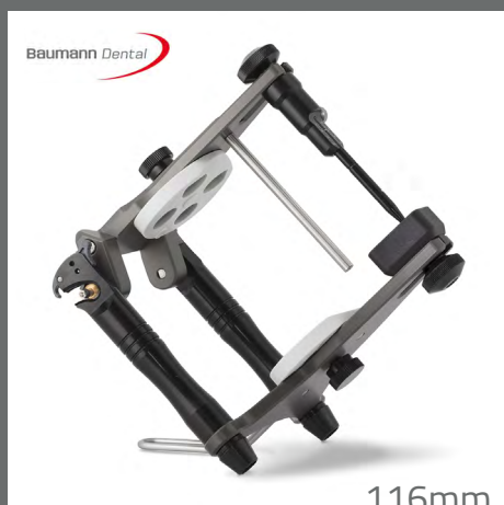
Arto 1 116 mm Cod. 12400