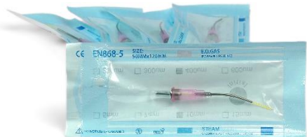
Kit Tip Laser 400um (5 pezzi) Codice: TL640