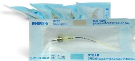
Kit Tip Laser 200um (5 pezzi) Codice: TL620