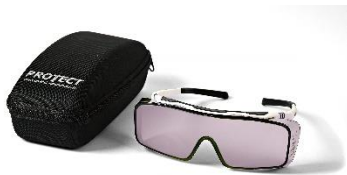
Occhiali di protezione laser 810nm Codice: LG5006