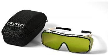
Occhiali di protezione laser 1064nm Codice: LG5006