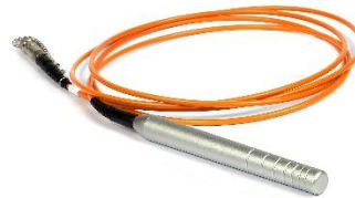
Manipolo Laser Codice: LH5001