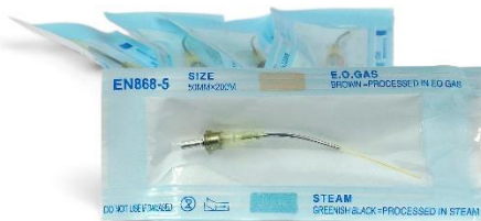
Kit Tip Laser 200um (5 pezzi) Codice: TL620