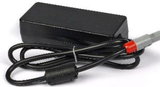
Caricabatterie Dispositivo Codice: LC5005