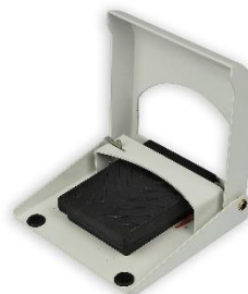
Pedale Wireless Codice: WF3008