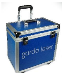
Trolley Codice: VL5017