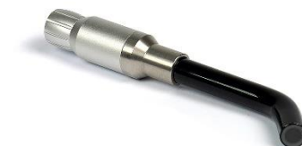
Puntale Terapia 60° Codice: TT5108