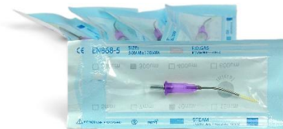
Kit Tip Laser 300um (5 pezzi) Codice: TL630