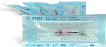
Kit Tip Laser 400um (5 pezzi) Codice: TL640