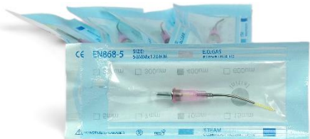
Kit Tip Laser 400um (5 pezzi) Codice: TL640