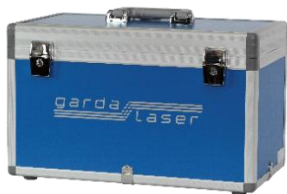
Valigia Codice: VL5013