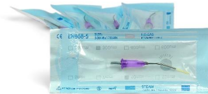
Kit Tip Laser 300um (5 pezzi) Codice: TL630