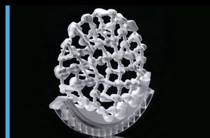
Ottimizzazione della superficie fresabile