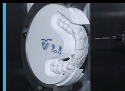
Fresatura frontale a 90°