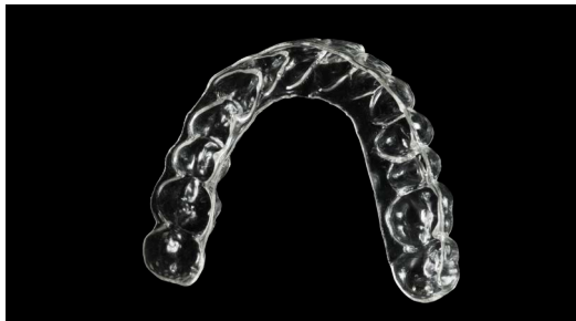
Allineatore stampato direttamente in 3D con resina Graphy Tera Harz TC-85 DAC, senza termoformatura

La stampa 3D è oggi una fase fondamentale per le realtà del mondo dentale che intendono sfruttare le enormi potenzialità del digitale. I materiali attualmente disponibili presentano caratteristiche fisiche e tecniche altamente performanti che consentono la realizzazione di manufatti durevoli, innovativi, estremamente remunerativi per il laboratorio e lo studio con procedure facilmente replicabili. Una gestione corretta e competente dei materiali e delle attrezzature è il prerequisito fondamentale per il successo di queste lavorazioni.