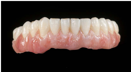
Manufatto definitivo realizzato con resina Graphy Tera Harz TC-80 DP