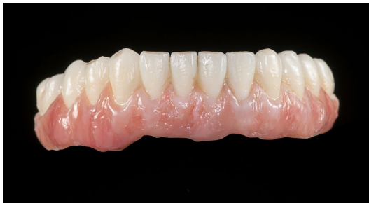
Manufatto definitivo realizzato con resina Graphy Tera Harz TC-80 DP