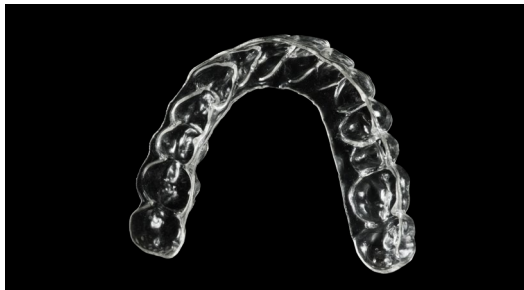
Allineatore stampato direttamente in 3D con resina Graphy Tera Harz TC-85 DAC, senza termoformatura

I materiali e le attrezzature attualmente disponibili per la stampa 3D dentale aprono al laboratorio potenzialità enormi: manufatti durevoli, innovativi ed estremamente remunerativi con procedure facilmente replicabili. Quanto è importante una gestione corretta e competente del flusso? In questo incontro facciamo chiarezza sui requisiti fondamentali per il successo della stampa 3D di definitivi, provvisori, allineatori diretti, bite.