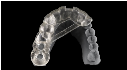
Dima chirurgica stampata in 3D con resina Graphy Tera Harz SG-100

I materiali e le attrezzature attualmente disponibili per la stampa 3D dentale aprono al laboratorio potenzialità enormi: manufatti durevoli, innovativi ed estremamente remunerativi con procedure facilmente replicabili. Quanto è importante una gestione corretta e competente del flusso? In questo incontro facciamo chiarezza sui requisiti fondamentali per il successo della stampa 3D di definitivi, provvisori, allineatori diretti, bite.