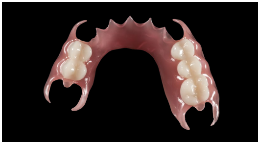
Base protesica flessibile stampata con resina Graphy Tera Harz TFDH ed elementi dentali definitivi con resina Graphy Tera Harz TC-80 DP