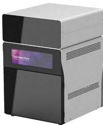
Fotopolimerizzatore Tera Harz Cure