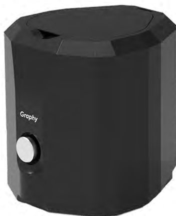
Tera Harz Spinner