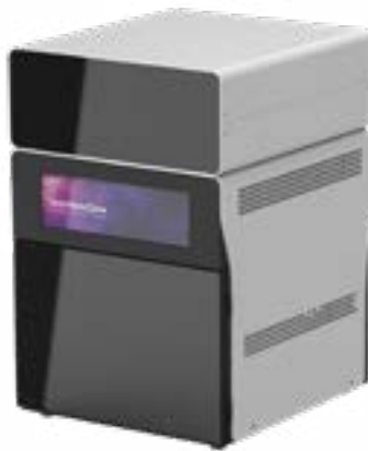
Fotopolimerizzatore Tera Harz Cure