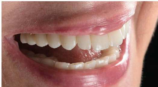
Manufatti protesici stampati in 3D con polimero Graphy Tera Harz TC-80 DP C&B

I materiali e le attrezzature attualmente disponibili per la stampa 3D dentale aprono al laboratorio potenzialità enormi: manufatti durevoli, innovativi ed estremamente remunerativi con procedure facilmente replicabili. Quanto è importante una gestione corretta e competente del flusso? In questo incontro facciamo chiarezza sulle applicazioni possibili con il materiale Graphy Crown&Bridge.