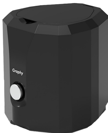
Tera Harz Spinner