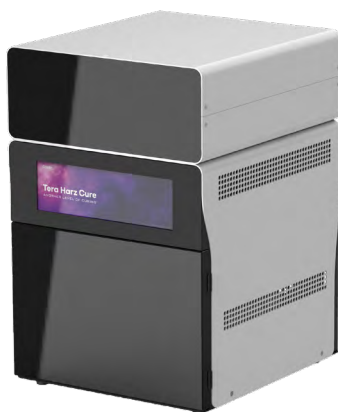
Fotopolimerizzatore Tera Harz Cure