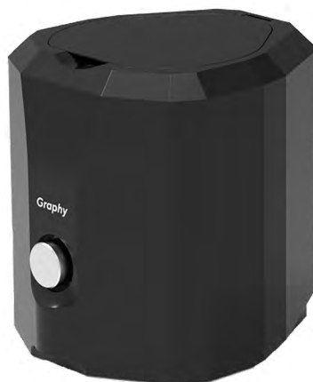
Tera Harz Spinner